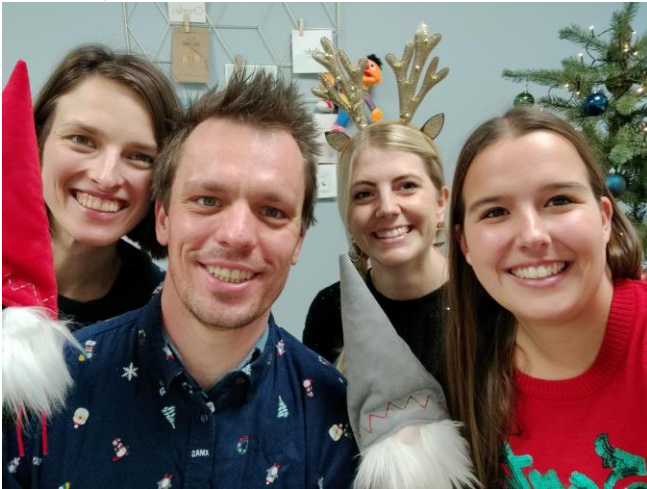
Team Huisartsen Stokrooie